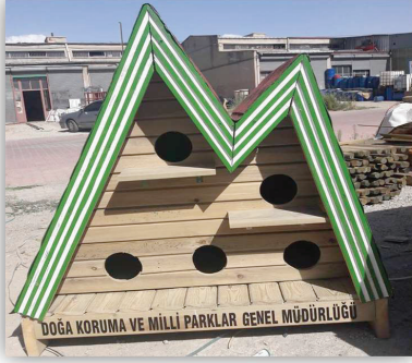
Resim 10. DKMP Kuş Evleri