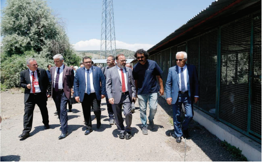
Resim 2. Ankara Büyükşehir Belediyesi Gölbaşı Sahipsiz Hayvan Geçici Bakımevi İnceleme Ziyareti