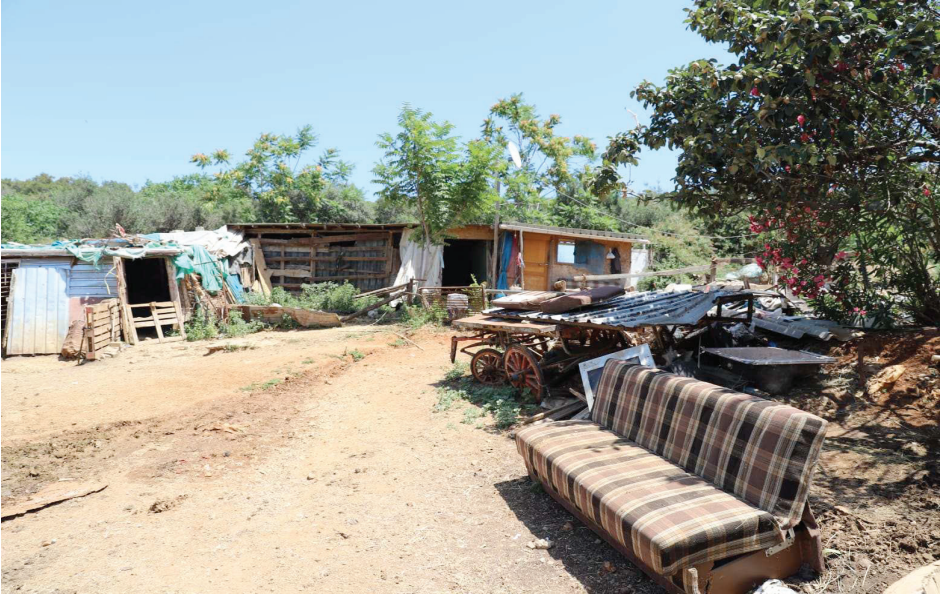
Resim 26. Kaçak Yapılmış Bir At Barınağı