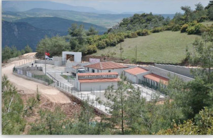
Resim 5. Bilecik Belediyesi Hayvan Bakımevi