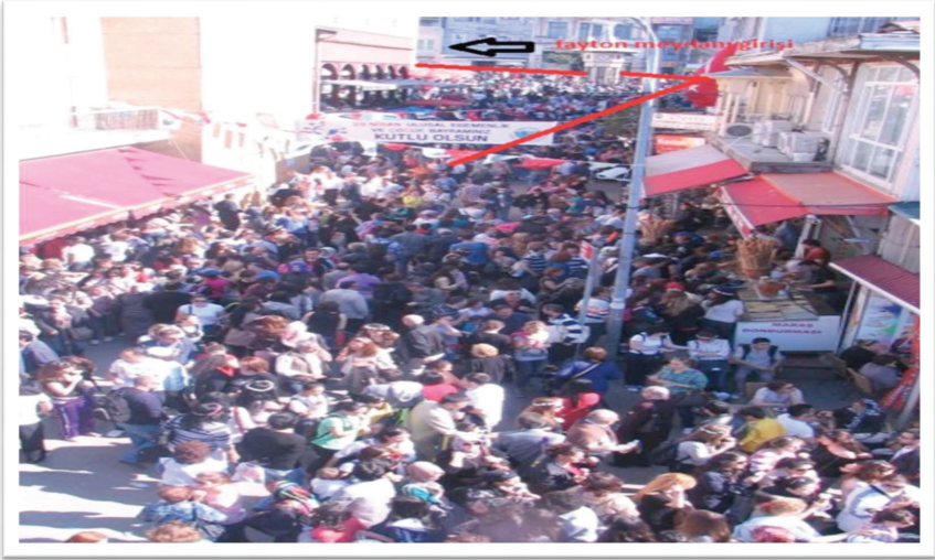
Resim 15. 23 Nisan 2019 günü saat meydanı kalabalığı ve fayton kuyruğu (Kırmızı çizgi fayton kuyruğunu göstermektedir.)