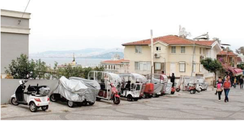
Resim 14. Adalarda Akülü Araçlar