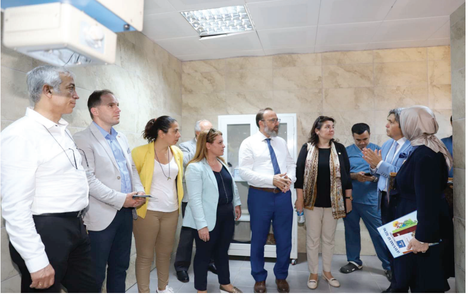
Resim 4. İstanbul Büyükşehir Belediyesi Tepeören Sahipsiz Hayvan Geçici Bakımevi ve Bahçeli Yaşam Alanı İnceleme Ziyareti