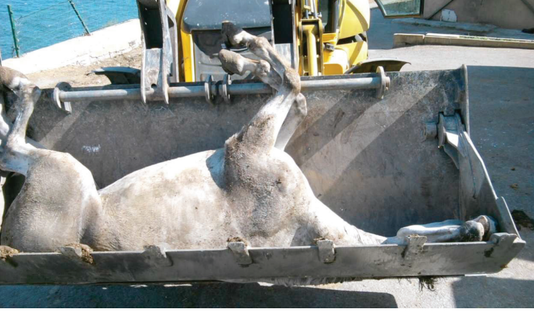
Resim 18. Adalarda Ölen Atların İlçe Belediyesi Tarafından Gömülmesi