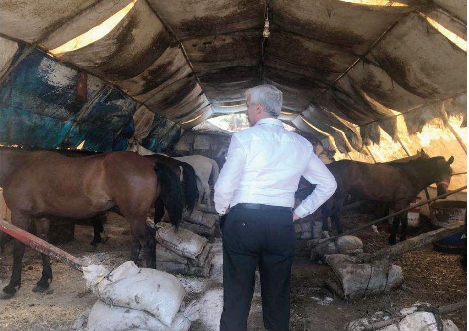
Resim 24. Aya Nikola At Barınakları-3