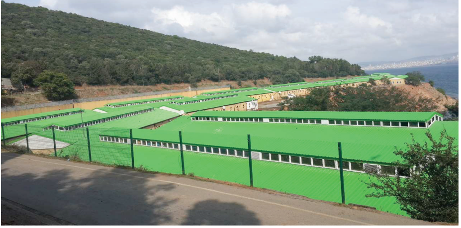
Resim 21. İSPARK Fayton Park Alanı