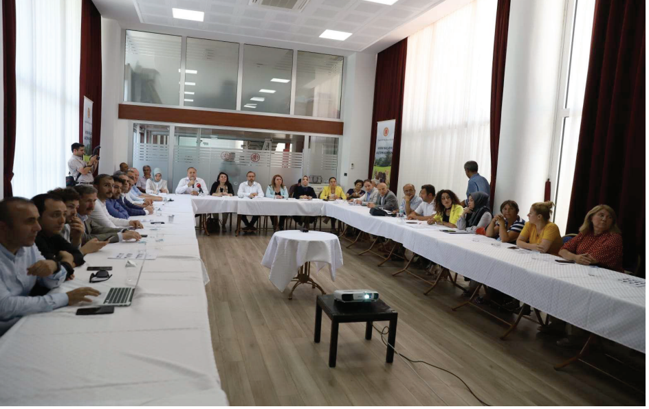
Resim 3. Adalar İlçesi İnceleme Ziyareti Kapsamında Büyükada'da İlgililerle İstişare Toplantısı