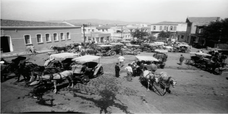
Resim 13. 1950'ler Büyükada Fayton Meydanı