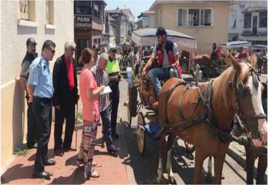
Resim 17. Fayton Denetlemeleri