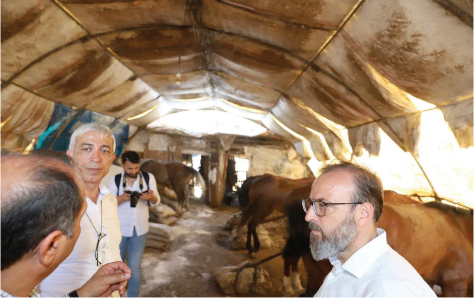
Resim 23. Aya Nikola At Barınakları-2