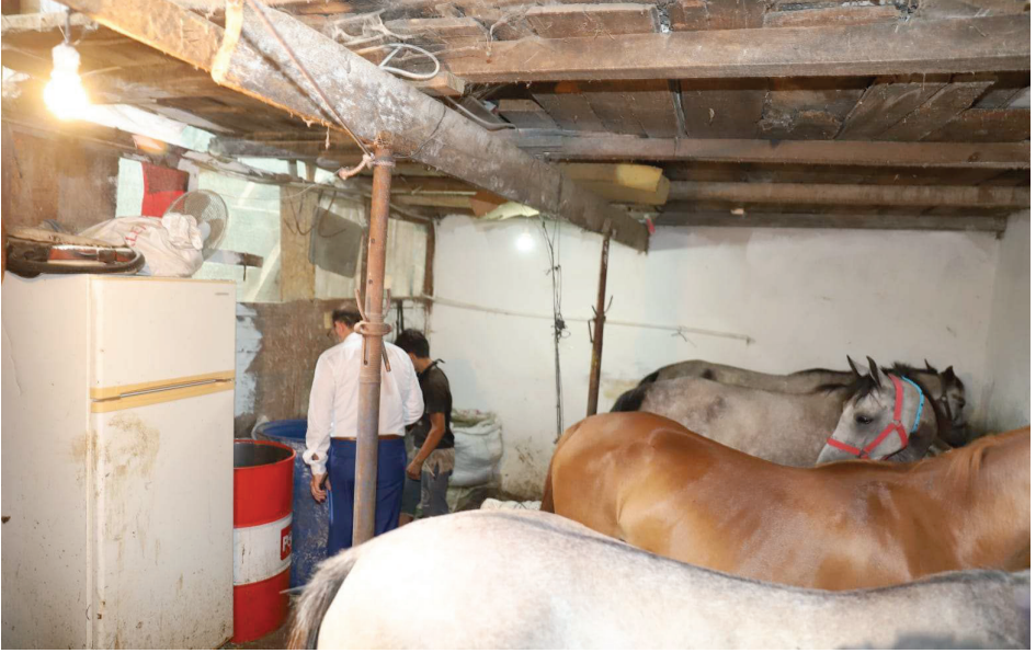
Resim 25. Aya Nikola At Barınakları-4