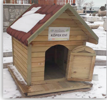
Resim 11. DKMP Genel Müdürlüğü Tarafından Hibe Edilen Köpek Evi

Hayvanların korunması ile ilgili halkın bilinçlendirilmesi maksadıyla Tarım ve Orman Bakanlığınca sivil toplum kuruluşlarıyla birlikte kamu spotları hazırlanarak ulusal kanallarda yayınlanmıştır. Bununla birlikte, hayvanların korunması ve hayvan sevgisi ile ilgili broşür, kitapçık ve poster bastırılmış olup, okullarda çeşitli eğitim ve gösteri faaliyetleri gerçekleştirilmiştir.