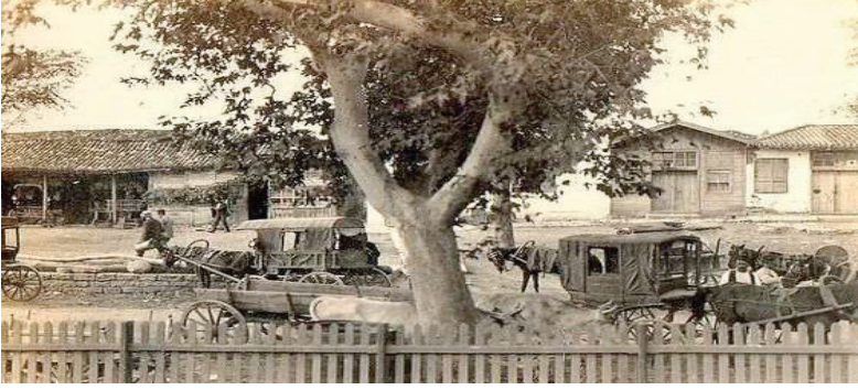
Resim 12. 1920'li yıllar Büyükada Eski Köy