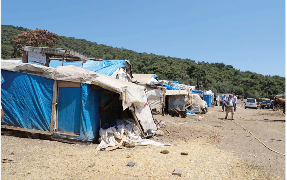
Resim 22. Aya Nikola At Barınakları-1