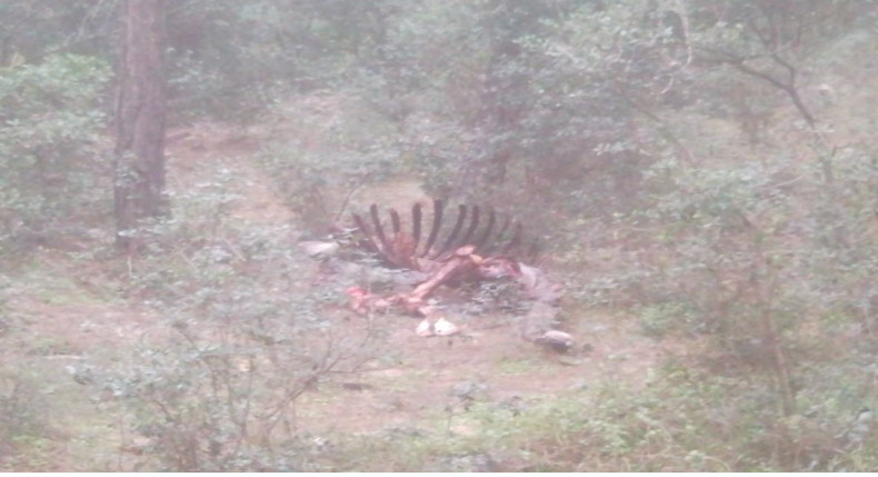
Resim 19. Orman İçinde Ölen ve Parçalanmış At