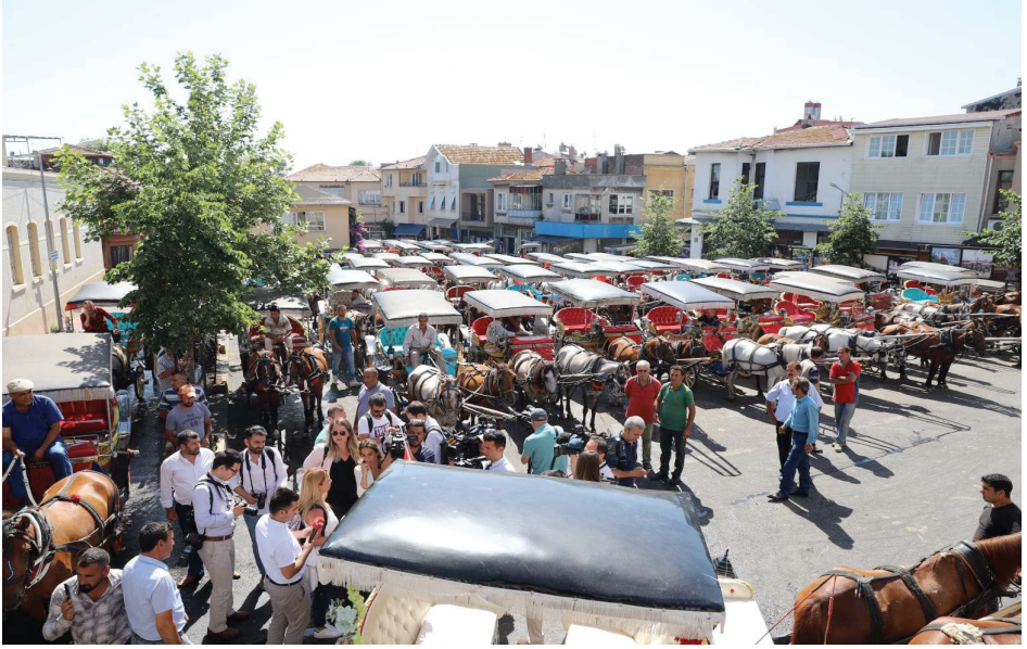
Resim 16. Büyükada Fayton Meydanı