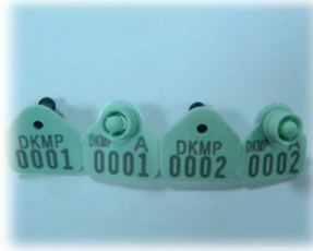
Resim 8. Kulak Küpesi