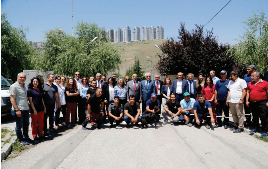
Resim 1. Çankaya Belediyesi Sahipsiz Hayvan Rehabilitasyon Merkezi İnceleme Ziyareti

26.06.2019 tarihinde Ankara’da, Ankara Büyükşehir Belediyesi Gölbaşı Sahipsiz Hayvan Geçici Bakımevi ile Çankaya Belediyesi Sahipsiz Hayvan Rehabilitasyon Merkezinde incelemeler gerçekleştirmiştir.