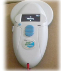
Resim 9. Mikroçip Okuyucu

Sahipsiz hayvanların barınması amacıyla 2017 ve 2018 yıllarında 1.349.375 TL tutarında kedi evi ve köpek kulübesi yaptırılarak dağıtımı sağlanmıştır.