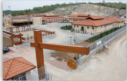
Resim 6. Kocaeli Büyükşehir Belediyesi Hayvan Bakımevi

Rehabilite edilen hayvanların işaretlenmesi amacıyla 2014-2018 yılları arasında 3.746.114 TL'lik mikroçip, kulak küpesi ve mikroçip okuyucu temin edilerek yerel yönetimlere dağıtımı yapılmıştır.