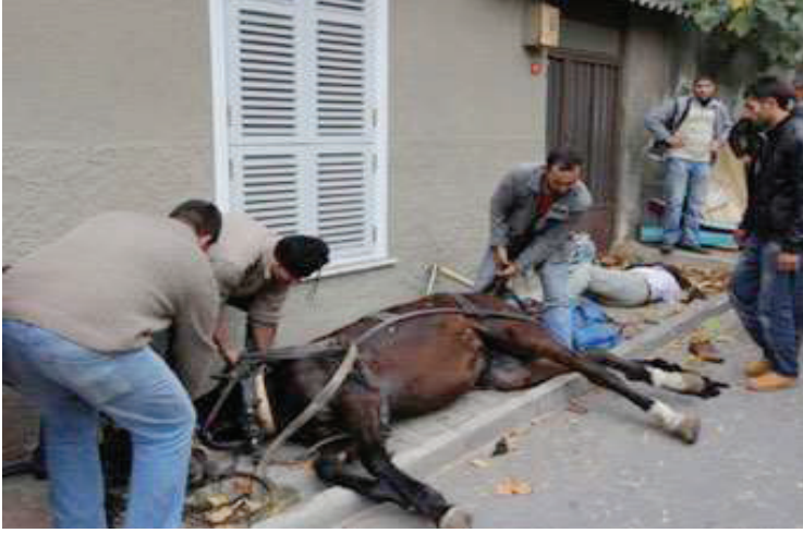
Resim 20. At Parlaması Sonucu Sürücünün ve Atların Öldüğü Bir Fayton Kazası

Sadece fayton atları değil, tüm yük hayvanlarının insancıl kullanımı ve refahlarının esas alınmasına yönelik düzenleme yapılması gerekmektedir.